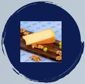
Znüni Käse / Bio Butter